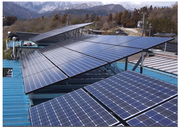
[写真]「おひさまファンド」の資金で設置された太陽光発電(長野県飯島町/民間事業所の屋根)。発電された電力の環境価値は、「グリーン電力証書」として全国に販売されます。

2008年6月まで市民ファンドとして国内最大規模の約9億円を、長野県南信州地域や岡山県備前地域で実施する合計1,450kW太陽光発電の設置(サッカーコート1.5倍の面積)や省エネルギー事業、森林資源(木質バイオマス)などを活用したグリーン熱供給事業などの事業に投資するために、2007年11月より募集開始。募集状況は、4月1日現在273名より1億5,540万円。市民の"お金"を直接、地球温暖化防止に役立てています。